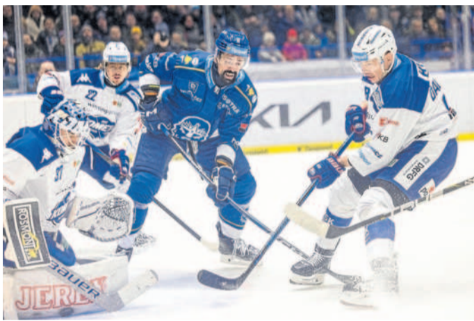
TUHÝ BOJ. Brněnští hokejisté (v bílém) si z kladenského ledu odvezli výhru 2:1 po prodloužení.

Od ní byli Brňané daleko. Do duelu sice kvalitně vstoupili, jenže jejich výkon rychle uvadal. „Úvod zápasu jsme měli velice slušný, ke konci první třetiny ale domácí hru srovnali a druhou třetinu byli jasně lepší. Tam