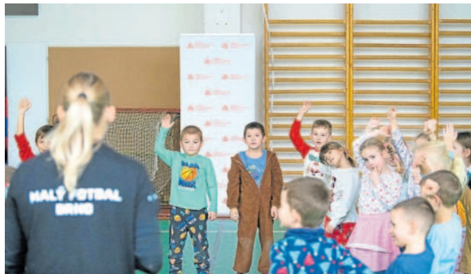
VÍC POHYBU. Trenéři se ve školách snaží ztraktivnit sport i pro ty nejmenší děti.

Malý fotbal Brno se ve spolupráci s dalšími odborníky snaží ztraktivnit formy tělesné výchovy tak, aby děti získaly pozitivní vztah k pohybu a měly zájem o následně organizované, ale i neorganizované sportování ve svém volném čase. „Je třeba zmínit, že v České republice, ale i celosvětově je zapojení dětí do pohybových aktivit nedostačující a radikálním způsobem se snižuje především v důsledku zájmů této populace o jiné aktivity, kte-