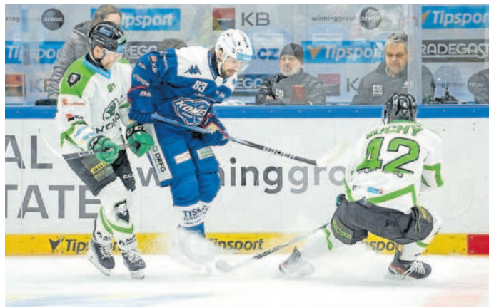
ČISTÉ KONTO. Kometa (v modrém) po perfektním výkonu dotáhla v tabulce Mladou Boleslav.

Kromě něj přivítali brněnští fanoušci zpět v sestavě i Šimona Stránského a posílená Kometa šlapala. Na Mladou Boleslav před utkáním ztrácela v extraligové tabulce tři body, pro vymazání ztráty udělala vše. Od úvodu domácí hráči makali,