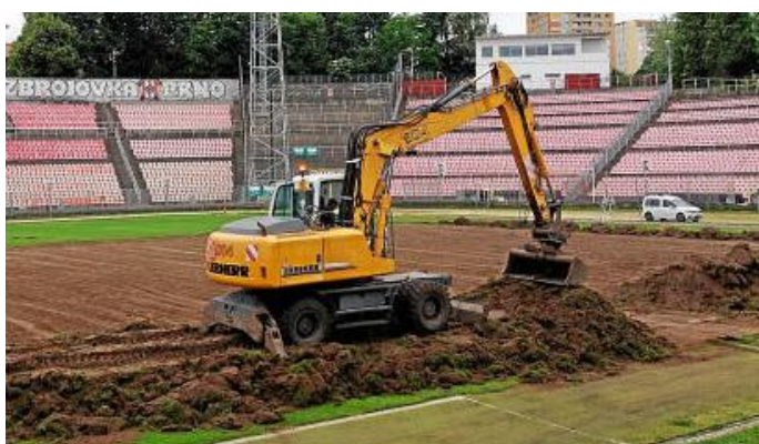
STROJE MÍSTO HRÁČŮ. Revitalizace trávníku stadionu v Srbské ulici začala 21. května.

Nový ročník bude rozlosován na konci června, třeba loni Brňané od červencového začátku sezony do konce