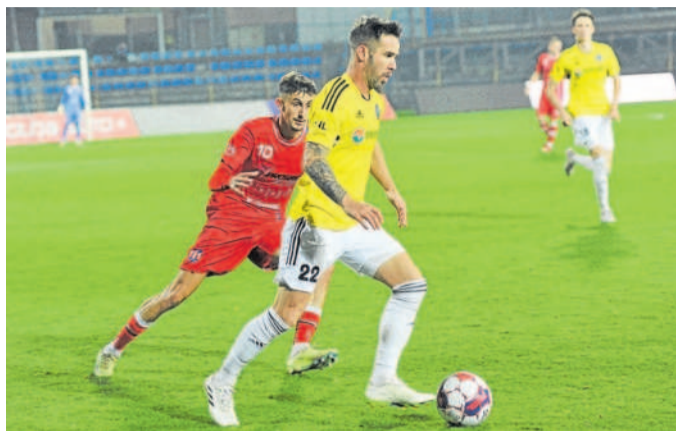
STŘED TABULKY. Líšeňští fotbalisté (v červeném) zakončili podzimní část sezony s jedenadvaceti body.

Druhou žlutou viděl těsně po hodině hry po faulu na půli hřiště. „Byl to skvěle rozehraný zápas, soupeře jsme měli na lopatě. A pak přišlo takové vyloučení. Těžko se mi to komentuje, ale Justin nás tím pohřbil, musíme si to vyříkat,“ zlobil se jihlavský kouč David Oulehla.