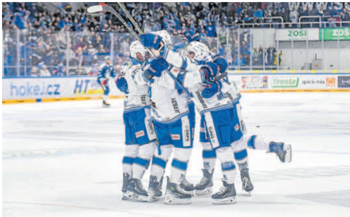
PĚTKA. Kometa se proti Liberci z gólu radovala hned pětkrát, Bílé Tygry skolila po obratu 5:2.

„Konečně mu to tam napadalo, doufám, že mu to pomůže. Očekáváme od něj, že bude dávat góly a rozhodovat zápasy, teď mu to vyšlo,“ popsal brněnský asistent trenéra Jiří Otoupalík. Hned dvakrát se Moses