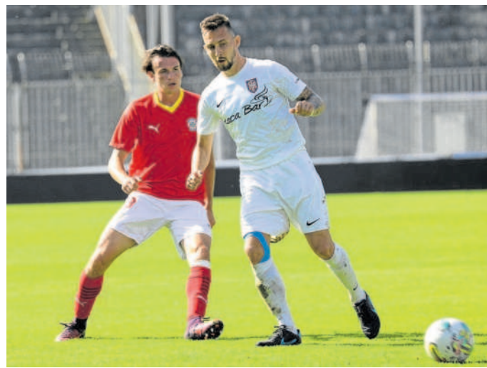
FAVORITÉ. Fotbalisté rezervy Zbrojovky Brno (v červeném) patří spolu s Lanžhotem mezi aspiranty na postup.