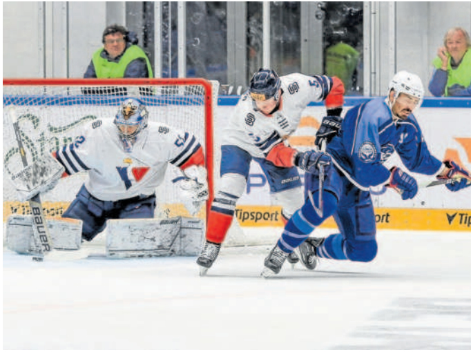
BOJ. Kometa (v modrém) úspěšně zvládla i závěrečné utkání přípravy, když porazila 3:1 Slovan Bratislava.

Po utkání třicetiletý reprezentant sršel dobrou náladou. Aby taky ne... Kometa totiž může do začátku extraligové sezony, který ji čeká v pátek v domácím souboji proti Hradci Králové, vstoupit optimisticky naladěná. Příprava jí vyšla jak výsledkově, tak herně. „Kádr se vhodně doplnil, kluci skvěle zapadli. Všichni se tak nějak