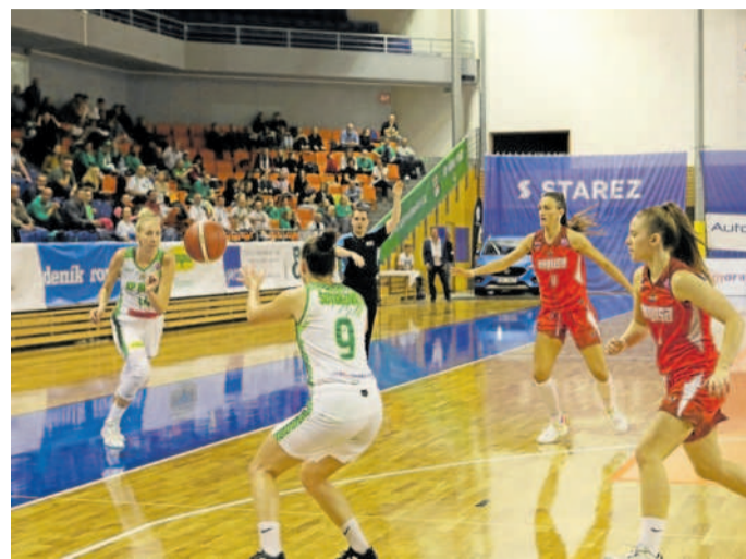
BITVA. Duel mezi KP Brno (v bílozelených dresech) a Dubrovnikem byl napínavý až do posledních vteřin.

Její svěřenky byly v utkání favoritkami, ovšem nabuzené soupeřky držely s Brňan-