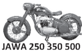
JAWA 250 350 500

SOLVENTNÍ sběratel koupí větší sbírku poštovních známek.774913398