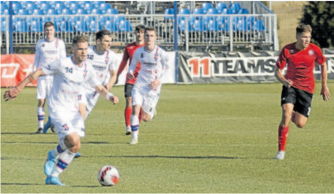
VÝHRA O DVA. V posledním vzájemném utkání Líšeň (v bílém) porazila Vyškov doma 2:0.