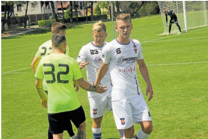
BOJ O MÍSTO. O víkend dostanou šanci všichni líšeňští fotbalisté (v bílém), mohou zabojovali o základní sestavu.

Zatímco dnešní zápas s Hostouň odehraje Líšeň na svém stadionu, zítřejší utkání je naplánované na jedno z tréninkových hřišť vicemístora první ligy. A navíc za zavržení dveří. „Šlo o přání Slavie, my jsme to akceptovali. Jsme rádi, že se s tako-