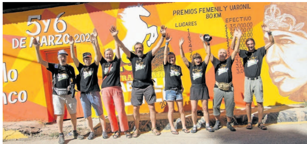
MĚDĚNÉ KAŇONY. Výprava českých běžců v mexickém Urique.

V březnu zvládl osmdesát kilometrů s výrazným převýšením za 8:14:59 hodin a