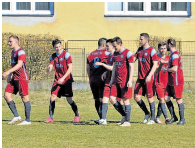
RADOST. Fotbalisté Kunštátu si na jaře užili dost radosti, korunují povedený půrok titulem?