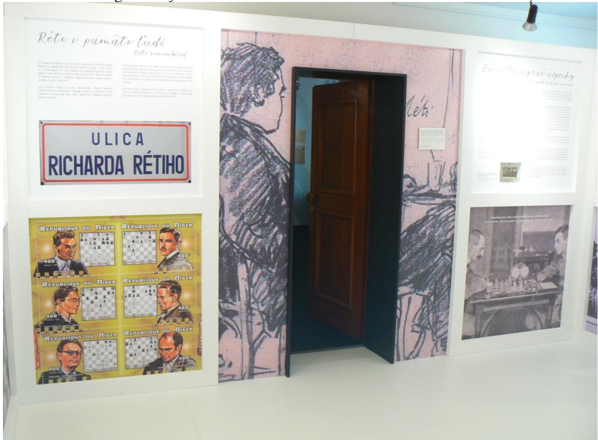
(Originálně řešená výstava o Réti – celoplošné panely a vchod a súčasne východ)